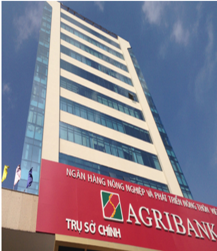
Trụ sở chính Agribank