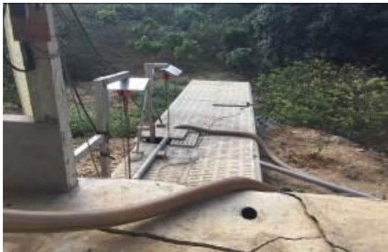
Bể chứa nước thải sau tách của trang trại ông Kiên