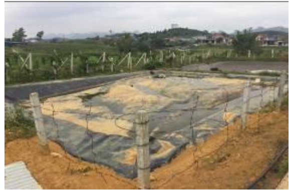
Bể KSH của nhà ông Lỗi (không hoạt động do bị hỏng)