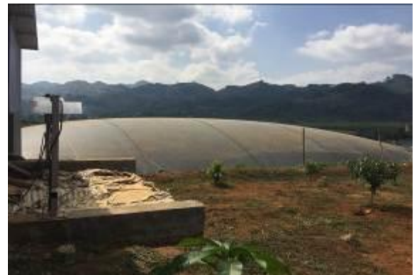
Bể KSH HDPE 5000m 3 nhà ông Bắc