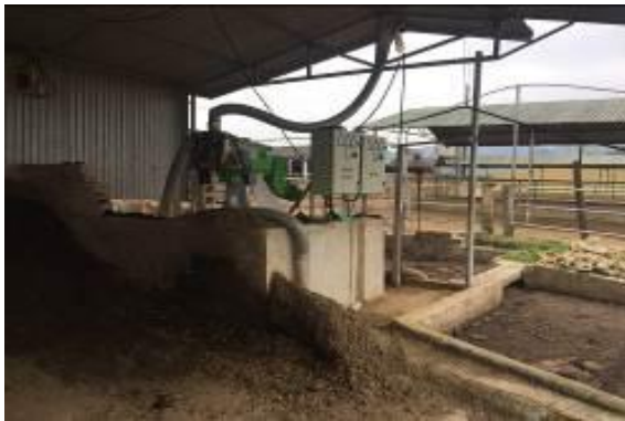
Máy tách phân của trang trại ông Lỗi