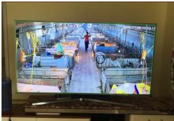
Mô hình nuôi lợn công nghệ 4.0 nhà ông Bắc