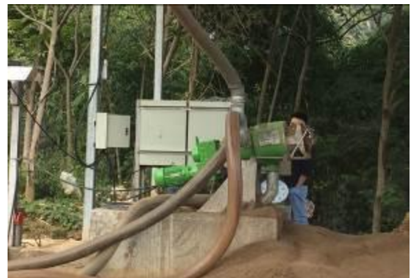
Máy tách phân nhà ông Giang