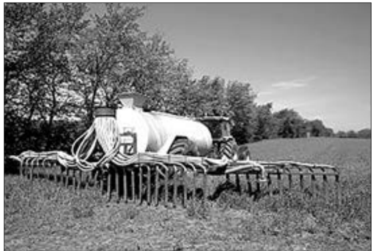
▲ Xe bón với hệ thống phun chất thải lỏng vào các rãnh bờ

Theo Báo cáo thống kê về chăn nuôi Việt Nam, nếu tính trung bình mỗi con lợn sử dụng khoảng 30 lít nước/ngày cho làm mát và vệ sinh chuồng trại thì hàng năm chỉ riêng chăn nuôi lợn đã thải ra khoảng 318 triệu m 3 nước thải chăn nuôi. Hiện nay, hầu hết các trang trại chăn nuôi ở Việt Nam đang áp dụng công nghệ khí sinh học như là công nghệ chính để xử lý NTCN. NTCN được đưa xuống hầm biogas, nước thải sau biogas được đưa qua các hồ lắng, hồ sinh học để làm sạch trước khi xả xuống nguồn nước mặt. Kết quả nghiên cứu của Dự án Hỗ trợ Nông nghiệp các bon thấp, việc áp dụng công nghệ khí sinh học hầu như không đem lại thu nhập bổ sung cho các chủ trang trại cũng như không giúp cho các chủ trang trại đáp ứng yêu cầu của QCVN 62 nên ở nhiều nơi, các chủ trang trại chỉ làm hầm biogas một cách hình thức gây tốn kém chi phí đầu tư mà không đem lại hiệu quả xử lý môi trường thực sự. Theo công bố của Công ty Cổ phần chuỗi thực phẩm TH, chi phí xử lý NTCN để đạt tiêu chuẩn QCVN 62 là khoảng 11.000 đồng/m 3 . Do vậy, nếu phải tuân thủ nghiêm ngặt quy định về môi trường theo QCVN 62 thì hàng năm sẽ tốn kém khoảng 3.500 tỷ đồng chỉ để xử lý môi trường chăn nuôi lợn.