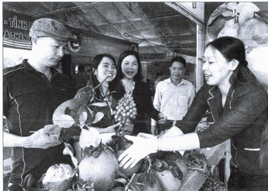
Giới thiệu sản phẩm OCOP Bến Tre cho khách tham quan